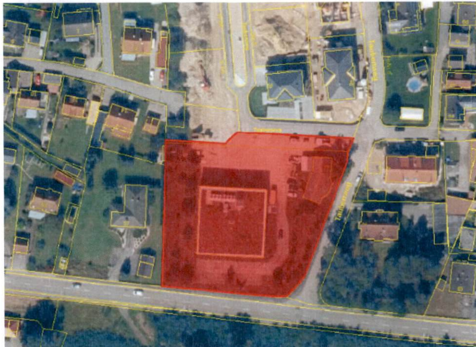
Abb. 1: Geltungsbereich vorhabenbezogener Bebauungsplan + Anpassung Flächennutzungsplan

Der Stadtrat der Stadt Nittenau hat in öffentlicher Sitzung am 14.11.2023 die Aufstellung des vorhabenbezogenen Bebauungsplans „Taubenweg 1-3“ mit Anpassung des Flächennutzungsplans in ein Allgemeines Wohngebiet (§ 4 BauNVO) auf den Grundstücken Fl. Nrn. 162/14, 162/19 Gemarkung Bergham beschlossen. Der Entwurf zur Aufstellung des vorhabenbezogenen Bebauungsplans „Taubenweg 1-3“ in der Fassung vom 14.11.2023 wurde vom Stadtrat gebilligt und beschlossen, diesen nach § 3 Abs. 2 BauGB öffentlich auszulegen und die Behörden und sonstige Träger öffentlicher Belange § 4 Abs. 2 BauGB zu beteiligen.