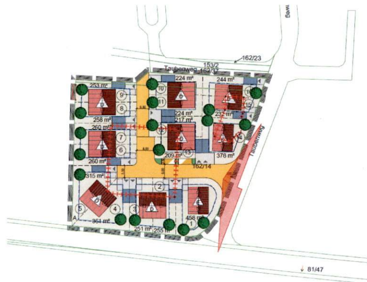
Abb. 3: Entwurf vorhabenbezogener Bebauungsplan