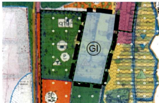
Abb. 1: Lageplan vom 28.02.2023, Geltungsbereich Flächennutzungsplan

Die Änderung des Flächennutzungsplans in ein Industriegebiet umfasst die Fl. Nrn. 1035/3, 1035/18 und 1035/20 Gemarkung Bleich.